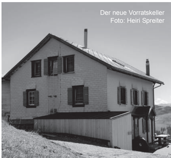
Der neue Vorratskeller

Das vor 40 Jahren erbaute Wasserreservoir genügt den heutigen hygienischen Vorgaben für Trinkwasser nicht mehr. Das Trinkwasserinspektorat des Kantons GR hat uns vor die Wahl gestellt, entweder aufwändig zu sanieren oder gleich zu ersetzen. Wir haben uns nach reiflichen Überlegungen für den Ersatz durch einen Kunststofftank am gleichen Standort entschieden. Die planerischen Vorbereitungen laufen bereits, die Realisierung ist auf Ende Saison 2024 oder Anfangs Saison 2025 vorgesehen.