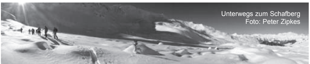
Unterwegs zum Schafberg