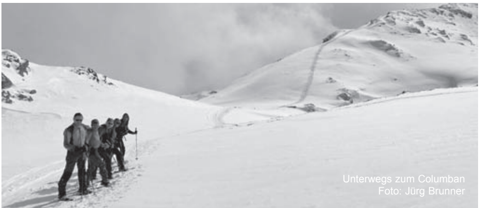
Unterwegs zum Columban

Auskunft: Annemarie Fülleemann, papillonaf57@gmail.com , 079 764 15 46