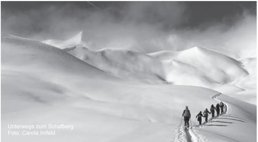
Unterwegs zum Schafberg