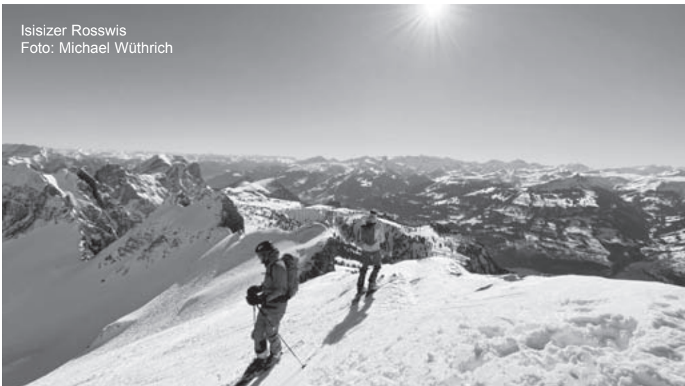
Isisizer Rosswis