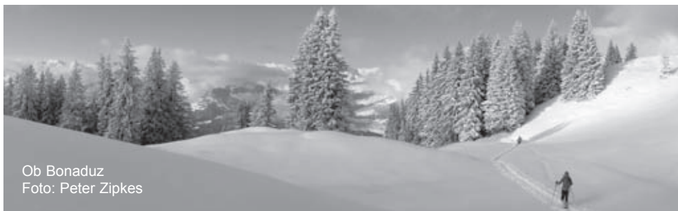
Ob Bonaduz