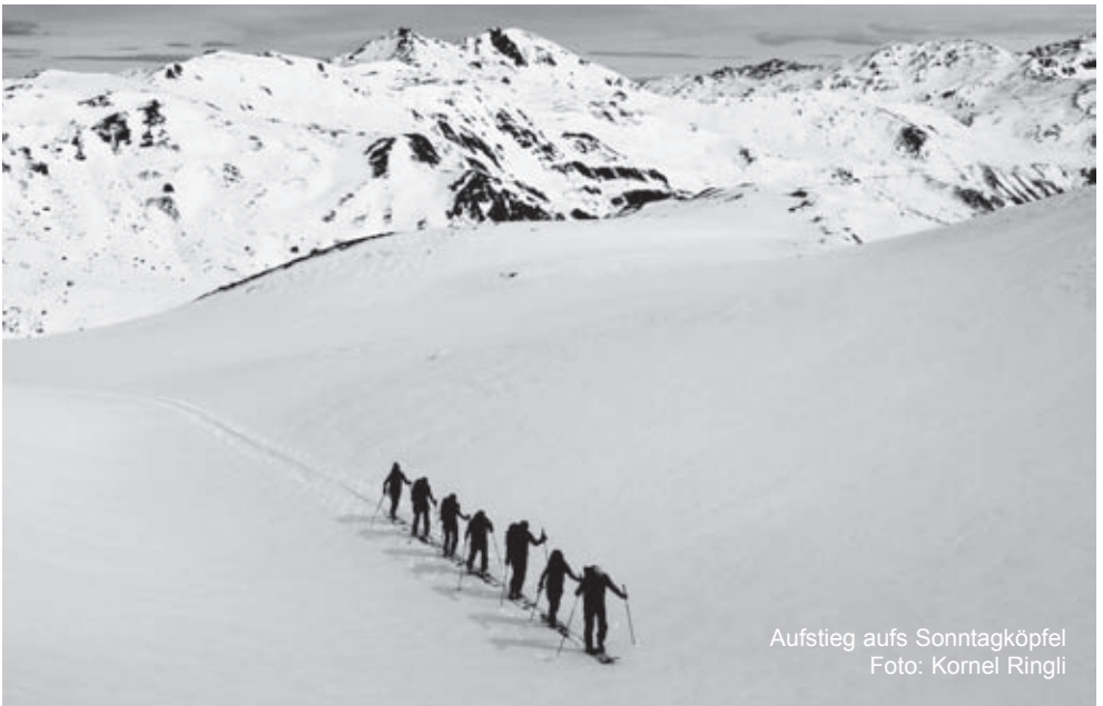
Aufstieg aufs Sonntagköpfel

Auskunft: bei der TL 043 833 62 30 oder 079 297 90 25