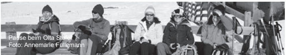
Pause beim Olta Stöckli

Karten: map.geo.admin.ch Ausrüstung: komplette Ausrüstung für Ss-Touren inkl. LVS, Schaufel und Sonden Verpflegung: aus dem Rucksack, ev. Einkehrmöglichkeit in St. Karl Reise: Männedorf (Schiff) ab 08.15h - Wädenswil ab 08.34h - Einsiedeln ab 09.03h (Bus B555) - Oberiberg, Talstat. Laucheren an 09.38h Billett: Wohnort - Hoch Ybrig Talstat. Laucheren und retour ab Ried, Muotathal Seilbahn Kosten: Billett SBB, Seilbahn und Spesen TL Anmeldung: auf www.sac-pfannenstiel.ch Auskunft: bei der TL 079 764 15.46