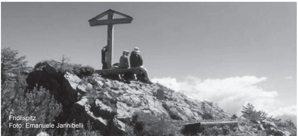
Fridlispitz