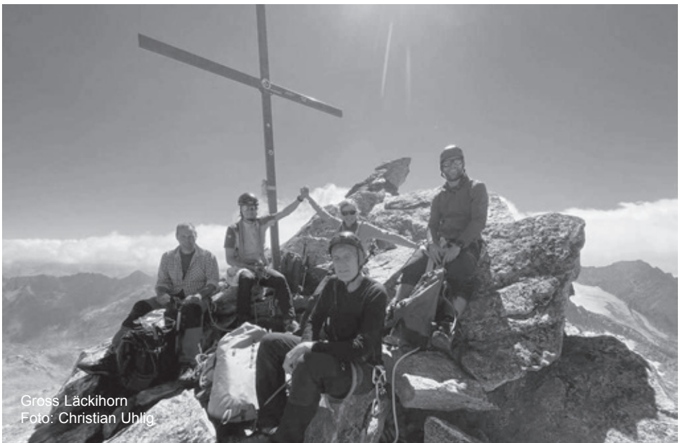
Gross Läckihorn