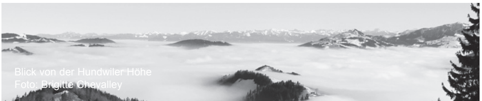
Blick von der Hundwiler Höhe

Karten: geo.admin.ch Ausrüstung: Wanderausrüstung nach Witterung Verpflegung: aus dem Rucksack Reise: mit öV Billett: Wohnort - Heiden retour Kosten: Billett + Spesen TL nach Reglement Anmeldung: auf www.sac-pfannenstiel.ch oder am Vortag von 17 - 18 Uhr, Tel. 043 833 62 30 Auskunft: bei der TL 043 833 62 30