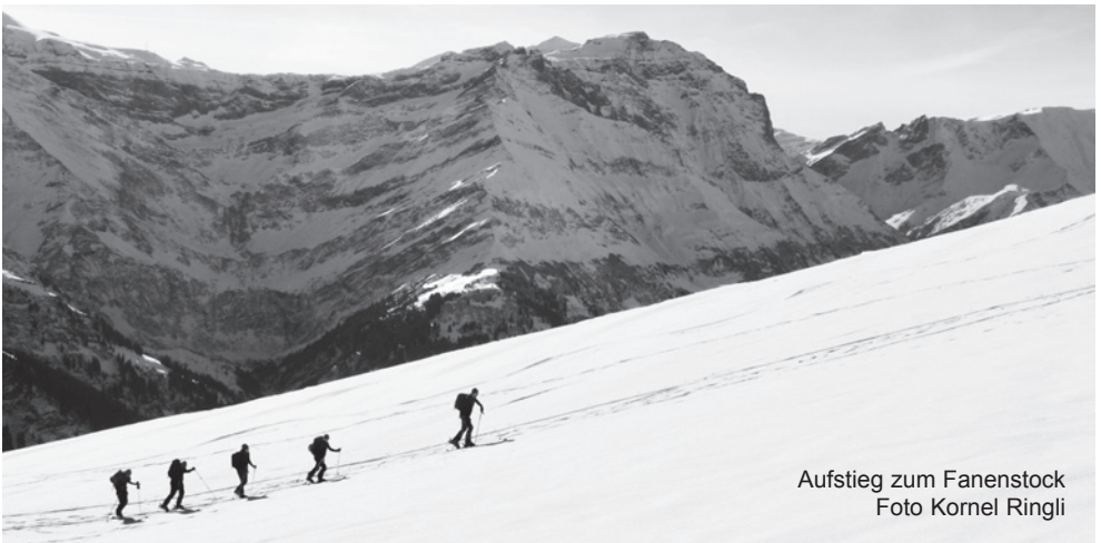
Aufstieg zum Fanenstock