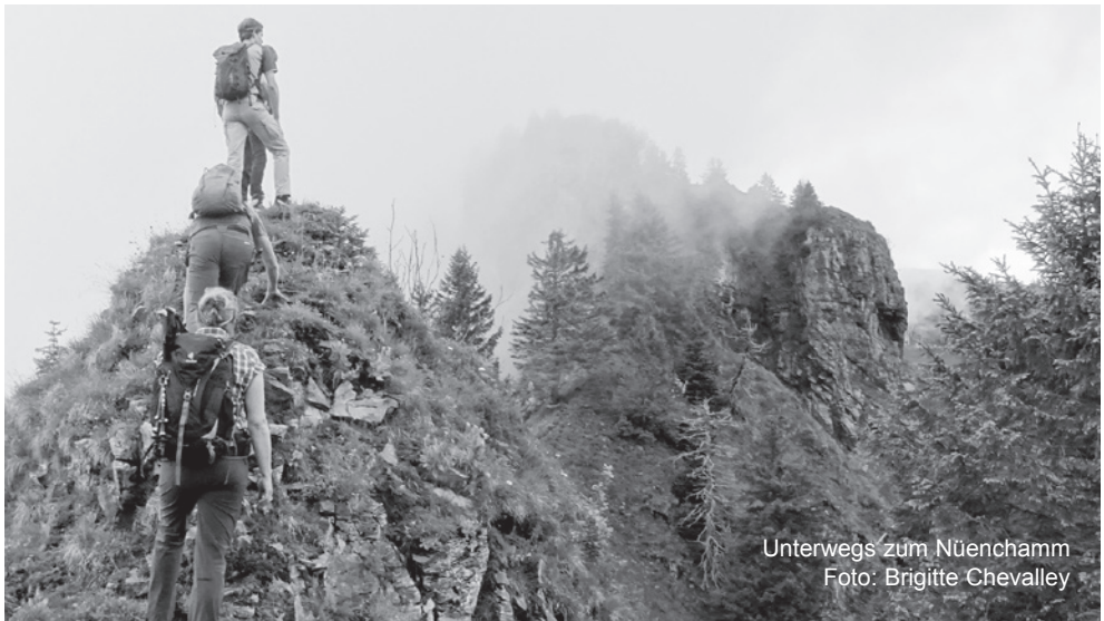
Unterwegs zum Nüenchamm

Auskunft: Tel. 044 920 37 51 od. 079 438 59 51