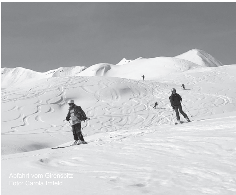
Abfahrt vom Girenspliz