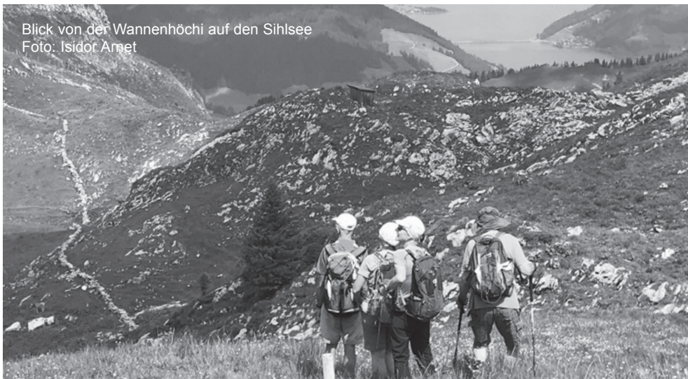
Blick von der Wannenhöchi auf den Sihlsee

Auskunft: Wolfgang Jambor, 079 409 98 43