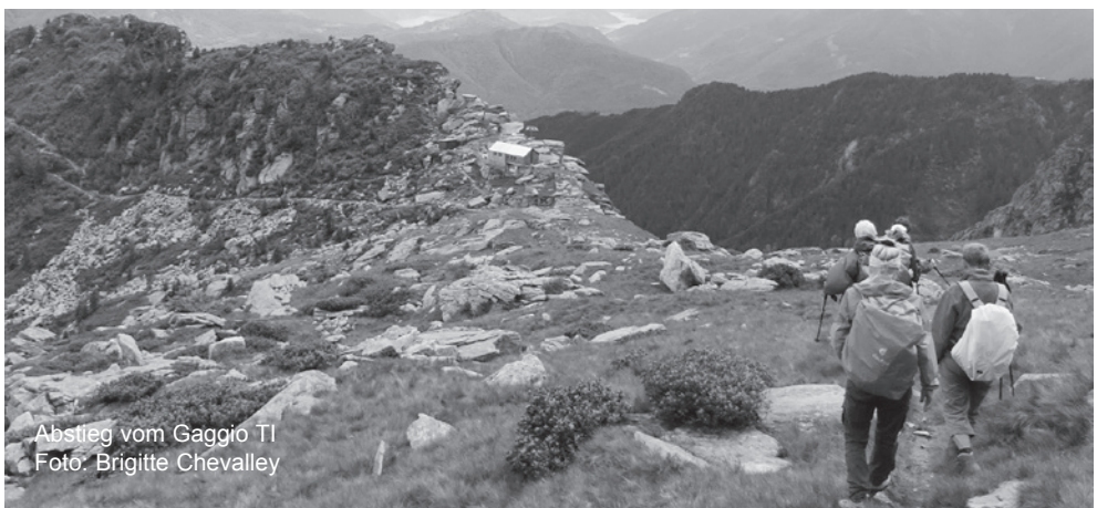
Abstieg vom Gaggio TI