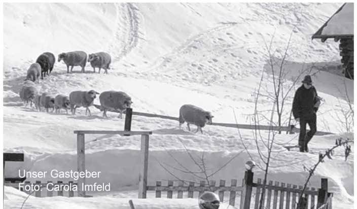
Unser Gastgeber