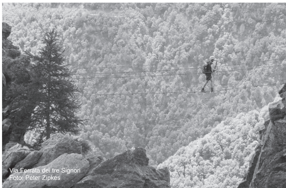
Via Ferrata dei tre Signori

Ueli Walther, Weingartenstrasse 20 8708 Männedorf, Tel. 044 920 13 22