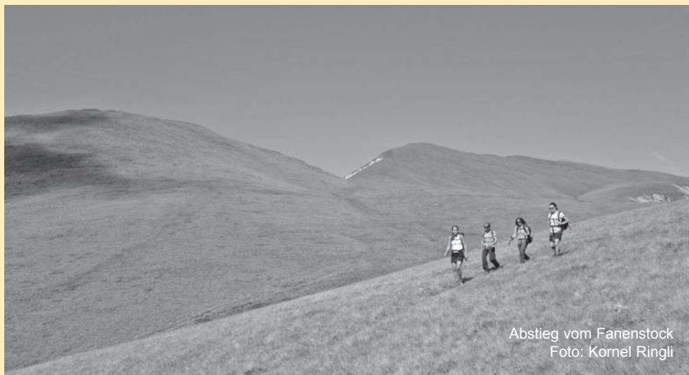
Abstieg vom Fanenstock