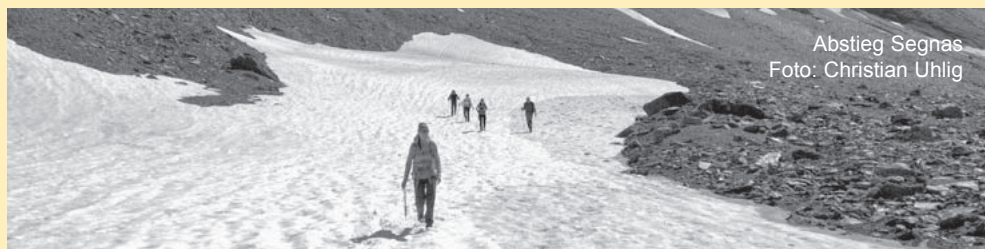
Abstieg Segnas