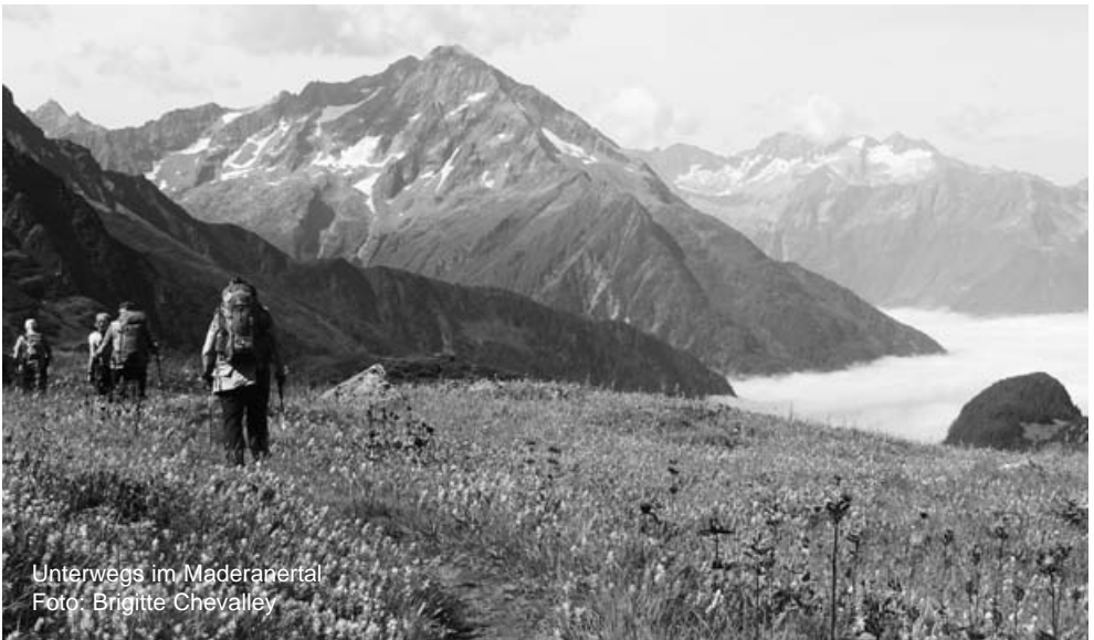
Unterwegs im Maderanental

Auskunft: Bitte angeben, ob Interesse an einem Mittagessen im alten Bad Pfäfers besteht.