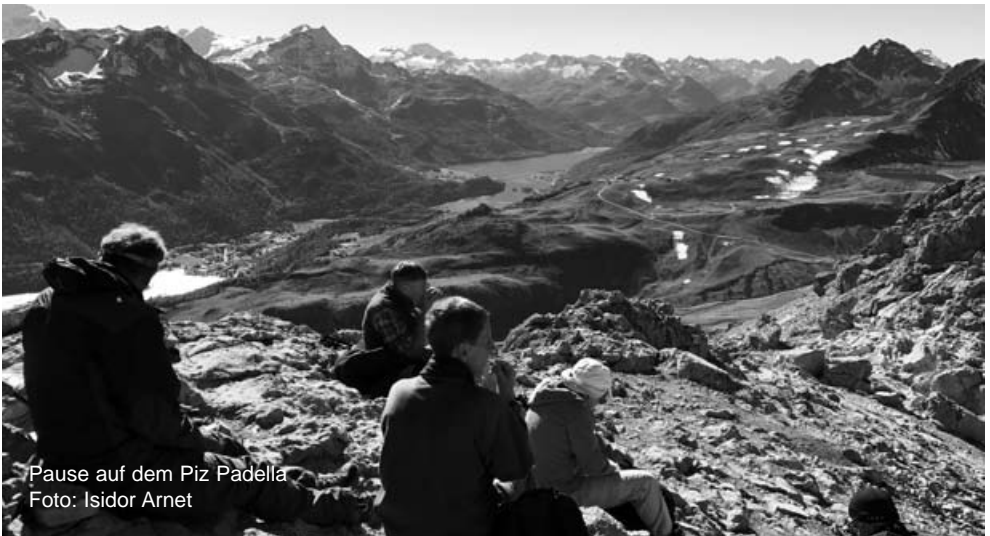
Pause auf dem Piz Padella

Karten: map.geo.admin.ch Ausrüstung: Bergschuhe Stöcke empfehlenswert Verpflegung: Aus dem Rucksack Reise: ÖV oder Fahrgemeinschaft Billett: Wohnort Malans Retour oder Fahrgemeinschaft ab Zürichsee Kosten: Älplibahn Anmeldung: auf www.sac-pfannenstiel.ch Spezielles: Anmeldung am Vortag Tel. 079 409 98 43 Auskunft: Beim Tourenleiter