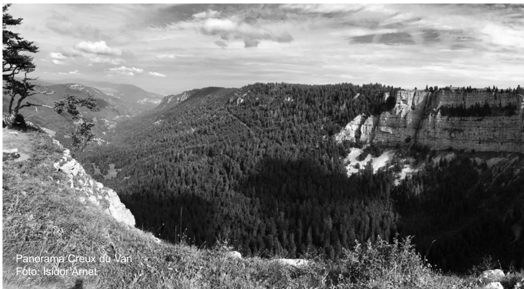
Panorama Creux du Van